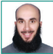
Eng. Abdulwahab Algallaf Minister of Electricity, Water and Renewable Energy Power Station Projects