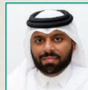
Hamad Jassim Al Bahar Director of Recycling & Waste Treatment Dep. Minister of Municipality, Qatar